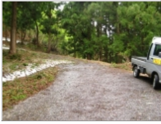
除雪終点より歩き始める