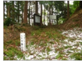
林道終点。本来の登山口