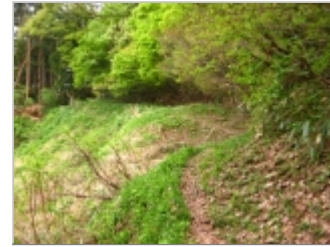
斜面をトラバース。ここは展望開ける