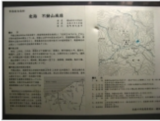
登山口の不動山城跡解説板