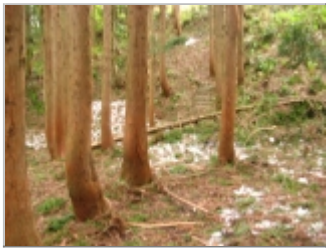
平坦地で右に曲がって山頂