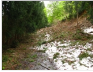
林道は雪に埋もれる